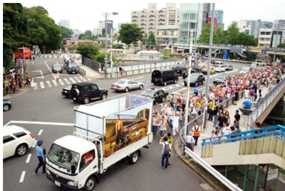
「Living Together」フロートで元気に行進