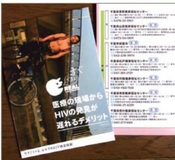
リーフレットには「おすすめ検査所」一覧が。夜間や休日もあります。