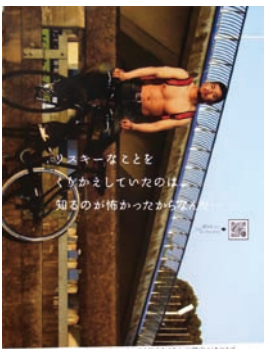
「できる！」第2期のポスター