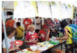
ブースも盛況でした

う気になる情報とともに、ちょっと勇気を出して検査に行ってみよう、という呼びかけを行ないました。